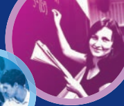
TABLEAU SUR LES CONTRATS ET LES AVENANTS